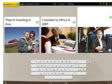
聽說讀寫 綜合訓練