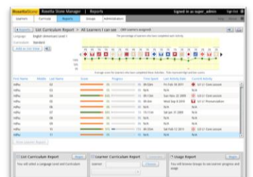
學習紀錄 歷程追蹤