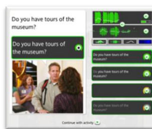
語音辨識 聲紋比對