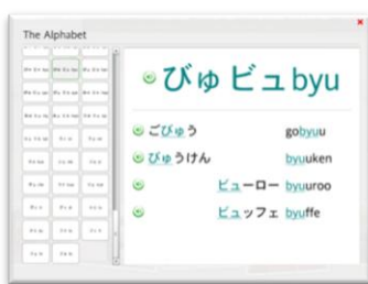
認識字母 基礎紮根